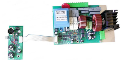
Typ HP HU-245P2 Hauptplatine zu HU-245