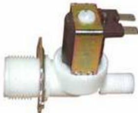
Typ MP WKLEP Einlassventil