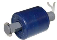
Typ SFLSOLVA2A1 Schwimmerschalter