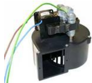
Typ Ventradiaal Ventilator zu HU-25/45/85