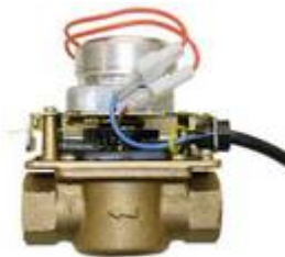
Water drain valve Auslassventil