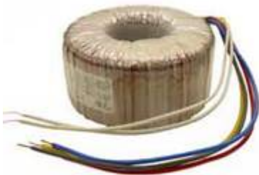
2.2525V200 Transformer for HU-45 2.2525V500 Transformer for HU-85 2.2525V625 Transformer for HU-245