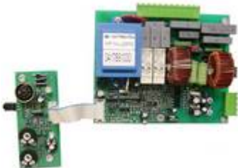
Typ HP HU -25P2 Hauptplatine für HU-25/HU-45