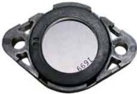
Typ XP MU 10 TRA 25 Schwinger zu HU-25/45/85/245