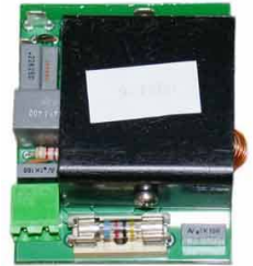
Typ HP MU 25 Treiberplatine für zwei Schwinger